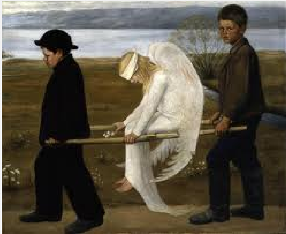
Sårad ängel, Hugo Simberg 1903